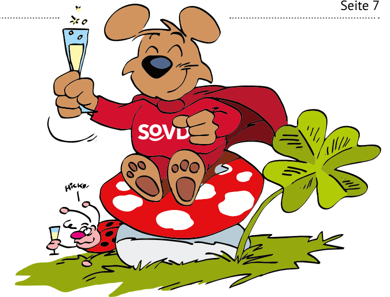
Illustration: Matthias Herrndorff

Schnell bis zum 19. Januar müssen Autofahrer*innen aktiv