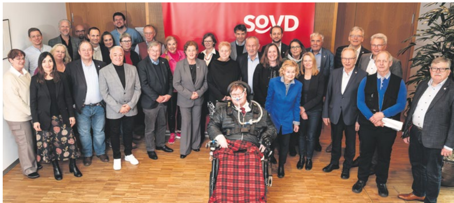
Gemeinsam und in großer Einigkeit entwickelten die SoVD-Landesverbände und der Bundesverband ihre Marschroute für die Wahlen.