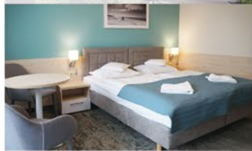
Zimmerbeispiel, 3+ Aparthotel Nad Parseta