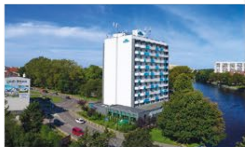
3+ Aparthotel Nad Parseta

Freizeit/Kur/Unterhaltung: Die Kur-Anwendungen erfolgen in den hauseigenen Behandlungsräumen. Es werden bspw. Moorpackungen, Bäder, Massagen und Inhalationen angeboten. Im Hotel befinden sich darüber hinaus ein kleines Schwimmbad (2 x 5 m, ca. 27°C), Whirlpool, Fitnessraum (kostenlose Nutzung) sowie eine Salzgrotte und eine finnische Sauna (jeweils gg. Gebühr).