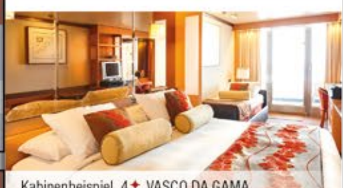
Kabinenbeispiel, 4+ VASCO DA GAMA

Unvergessliche Erlebnisse am Polarkreis Kiel - Bergen - Geiranger - Lofoten - Nordkap - Trondheim - Kiel Reiseternin: 26.06. - 11.07.2025; 11.07. - 26.07.2025; 21.08. - 05.09.2025 16 Tage p.P. ab € 3.150,-* statt € 3.499,-